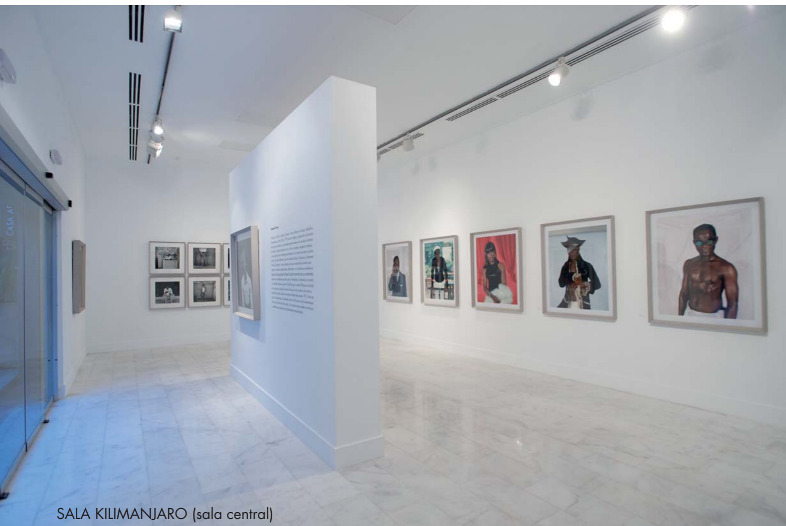
SALA KILIMANJARO (sala central)