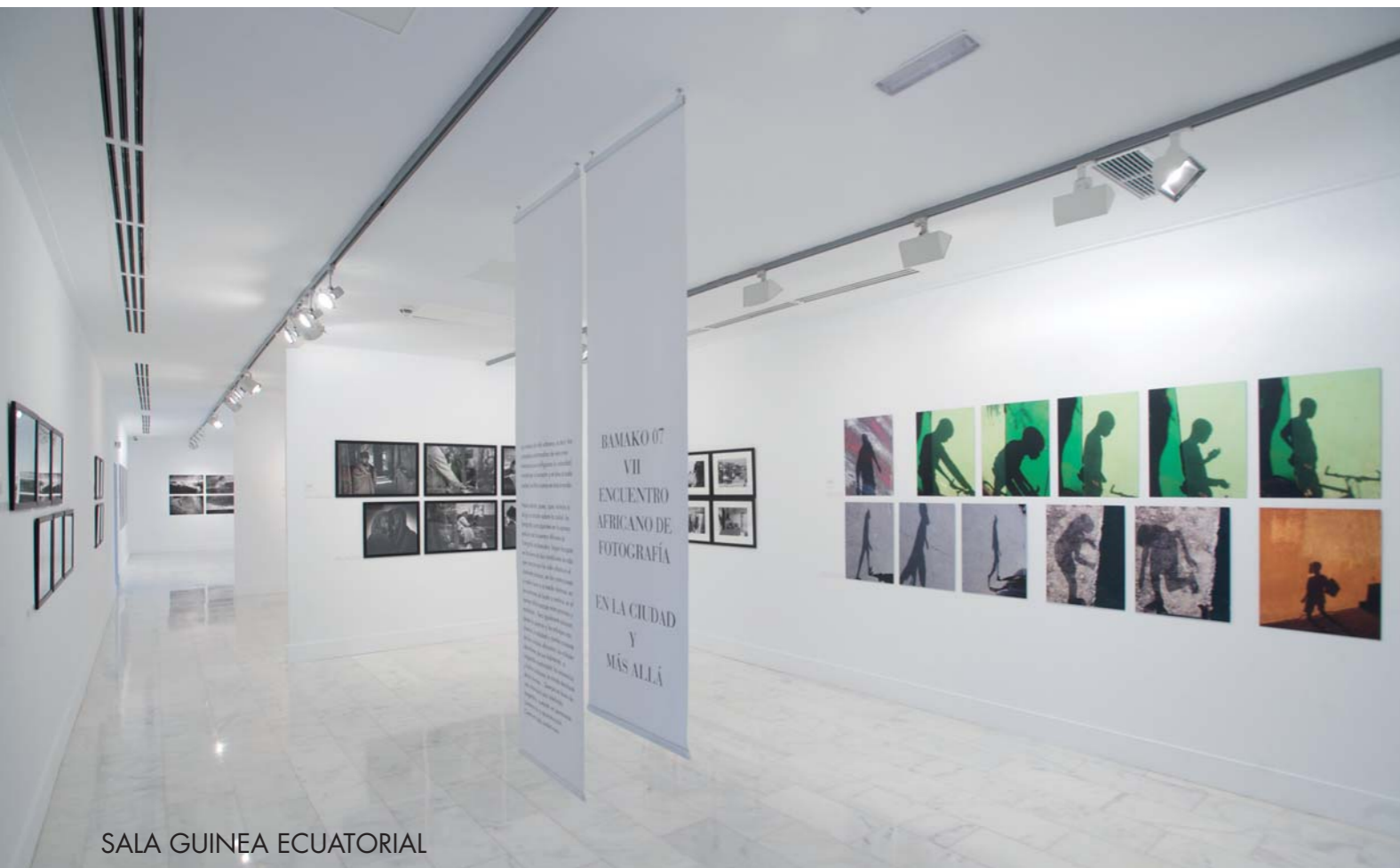
SALA GUINEA ECUATORIAL