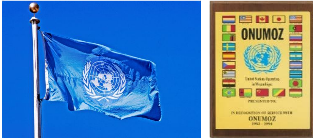
Figura 3. ONUMOZ: Operación de las Naciones Unidas en Mozambique y países integrantes de ONUMOZ.

Mozambique (ONUMOZ) y un contingente de observadores internacionales, entre ellos 20 españoles, se desplegó en el país para verificar los acuerdos firmados.