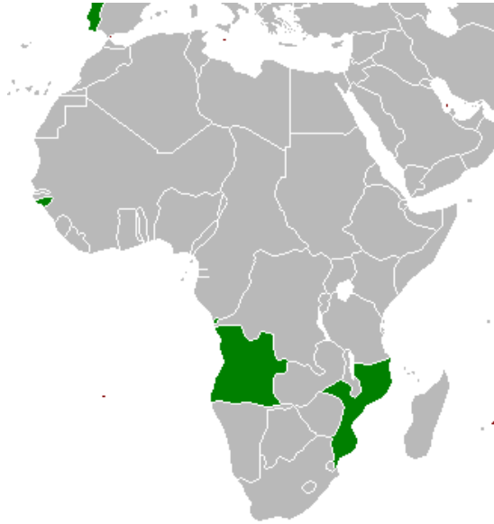
Figura 2. Colonias portuguesas en África.

El presidente del FRELIMO, Samora Machel, trató de modernizar el país siguiendo los patrones de la URSS. Para ello, nacionalizó empresas, estableció un férreo control de la población, eliminó la cultura tribal y redujo la influencia religiosa. Los Estados Unidos, preocupados por la expansión soviética en el África subsahariana, junto a Sudáfrica, que veía cómo el comunismo se instalaba en su frontera, crearon un grupo opositor al FRELIMO llamado Resistencia Nacional de Mozambique (RENAMO). Las luchas entre ambos movimientos dieron lugar a una guerra civil de 15 años. Para no distraer tropas mozambiqueñas involucradas en la guerra, Samora Machel acordó con los Gobiernos de Malawi y Zimbabue el despliegue de sus soldados en Mozambique para garantizar la seguridad de las comunicaciones con ambos países.