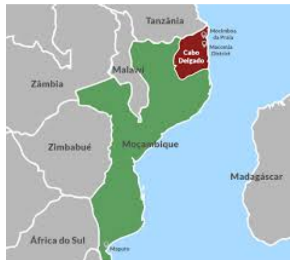
Figura 4. Mozambique y Cabo Delgado.