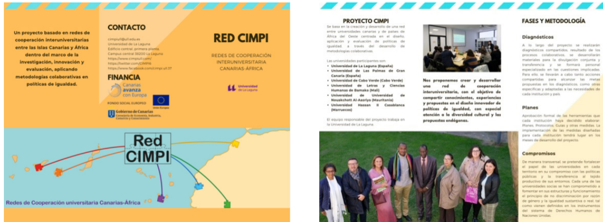
Imagen 3. Díptico divulgativo del proyecto Red-CIMPI difundido en el marco de las Jornadas Macaronight 2019.

con una asistencia de más de 2500 personas, fue organizada por la Universidad de La Laguna en septiembre. Estos resultados quedan también expuestos en el próximo apartado, que presenta el resultado de los Diagnósticos Iniciales Red- CIMPI realizados por cada universidad.