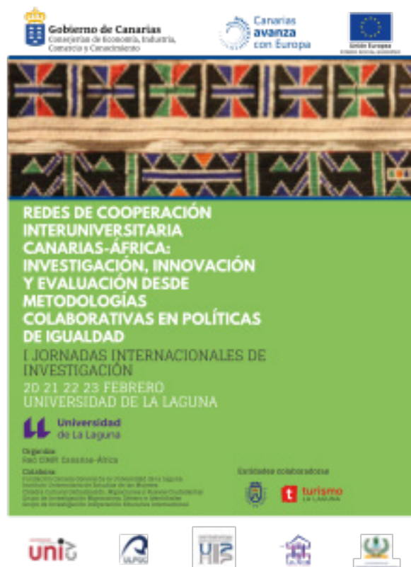
Imagen 2. Cartel anunciador de la I Jornadas Internacionales de Investigación Red-CIMPI.

A partir de los diagnósticos iniciales y del resto del trabajo procesual realizado (acciones comunes y específicas), la Red se plantea la elaboración de planes, protocolos, guías y otras medidas concretas dirigidas a la igualdad de oportunidades. Estas iniciativas deben ser generadas a partir de las necesidades de cada universidad (Objetivo General 4).