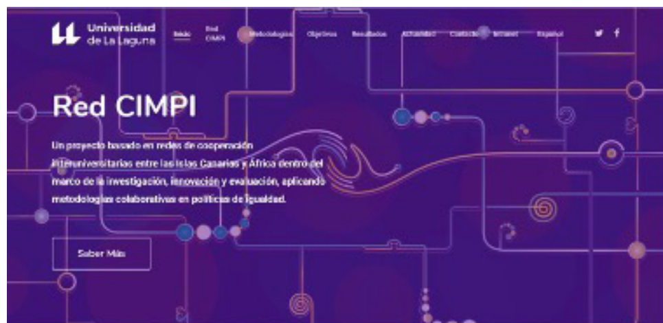
Imagen 1. Página web Red CIMPI

Para facilitar el trabajo de la red y fortalecerla desde el inicio, se creó una web de divulgación del proyecto ( www.cimpiull.com ). En esta web se cuenta, entre otros espacios, con una intranet para el trabajo colaborativo , con diversas herramientas tecnológicas de trabajo académico - Group Ware.