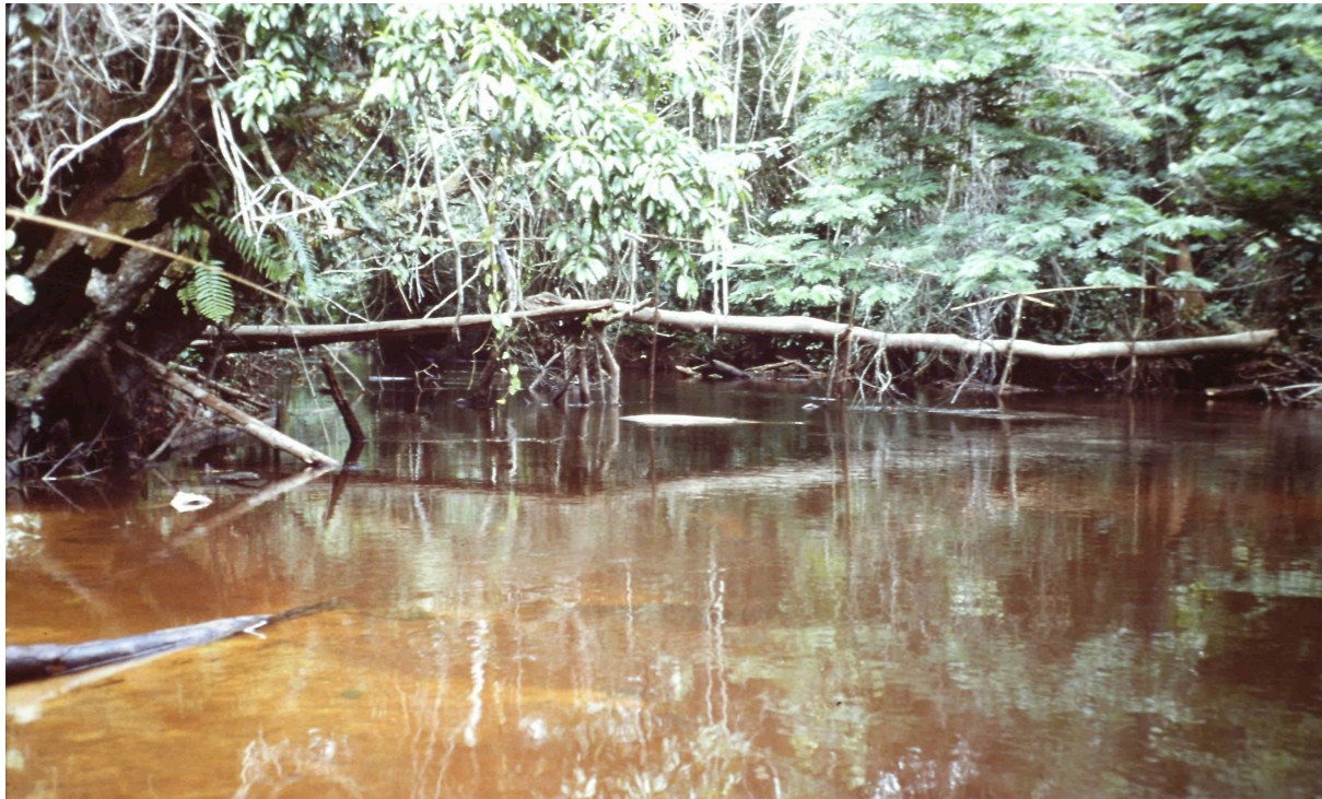
Un camino para ir a las plantaciones particulares de café

Visitando las pequeñas plantaciones de café que la gente tiene de forma particular, situadas en espacios de difícil acceso. Ésta es prácticamente la única fuente de ingreso que tienen.