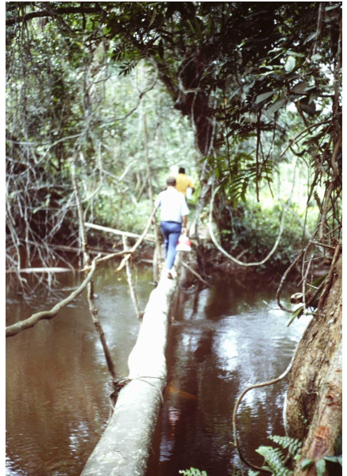
Yo yendo a visitar las plantaciones particulares