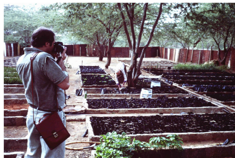
Yo fotografiando las parcelas de los hortelanos