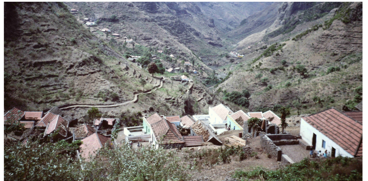
Pueblos de la isla de Praia

A través de Intermón hice una aportación económica directa para mejorar las escuelas.