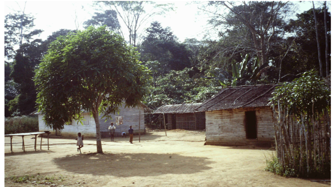
Casas de los pueblos

Como no había ninguna posibilidad de hacer proyectos de desarrollo fuera del control del gobierno decidí, igual que las ONGs en general, no realizar ningún proyecto en Guinea Ecuatorial.