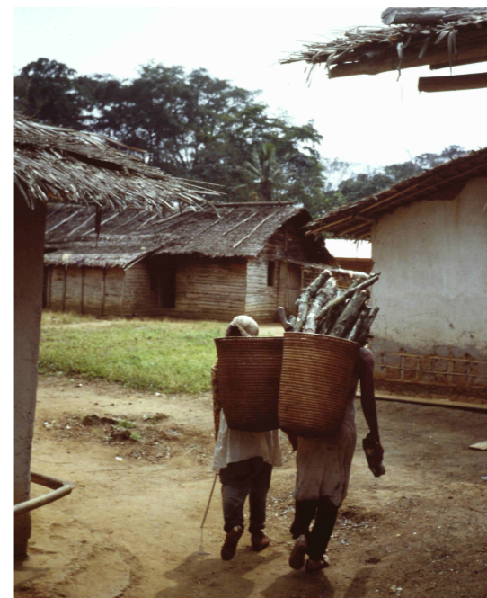
Al volver del trabajo, la gente lleva leña para casa