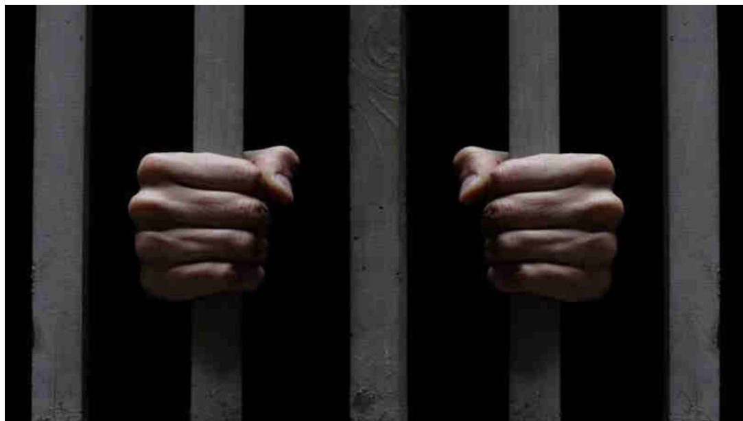
Cárcel en Cabo Verde

Cabo Verde fue la principal prisión de esclavos procedentes de África y desde aquí eran recogidos por barcos más grandes que los llevaban a América. entre 1501 v 1641.