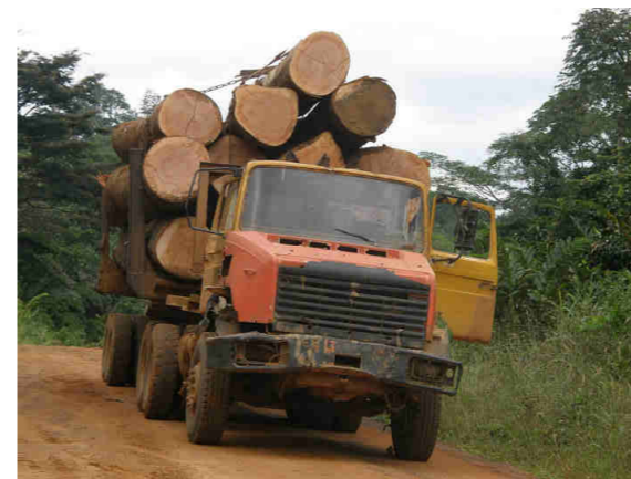
Los árboles de la selva