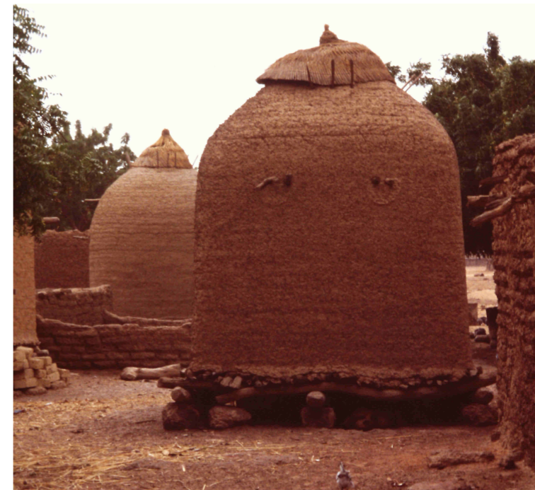
Graneros tradicionales burkinabés