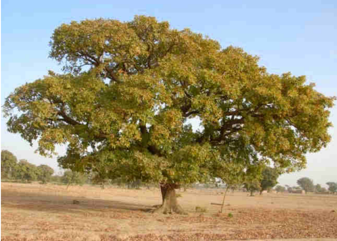
El árbol del karité