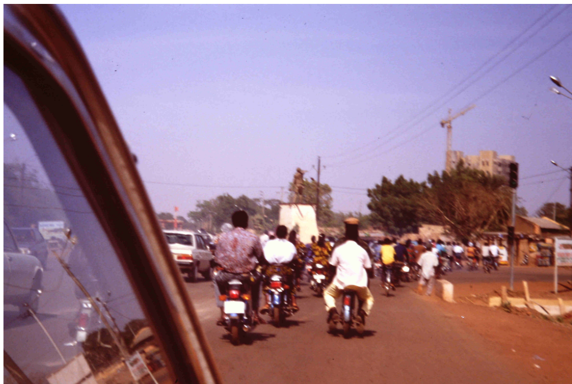
Las mobylettes en la ciudad