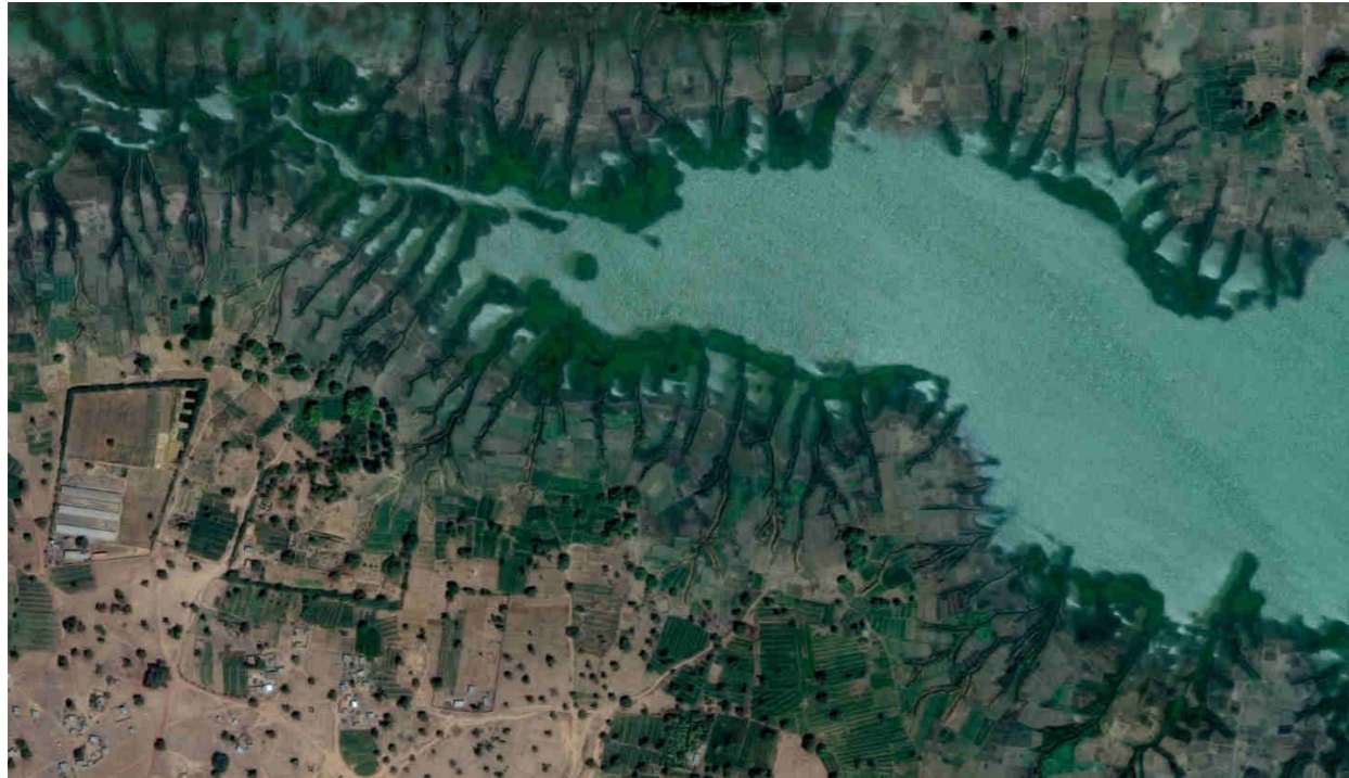
Pequeño lago en el río Nakambé

Otro proyecto fue la canalización de agua del río Nakambé (antiguo Volta Blanco) para proveer de agua los pozos de las huertas familiares.