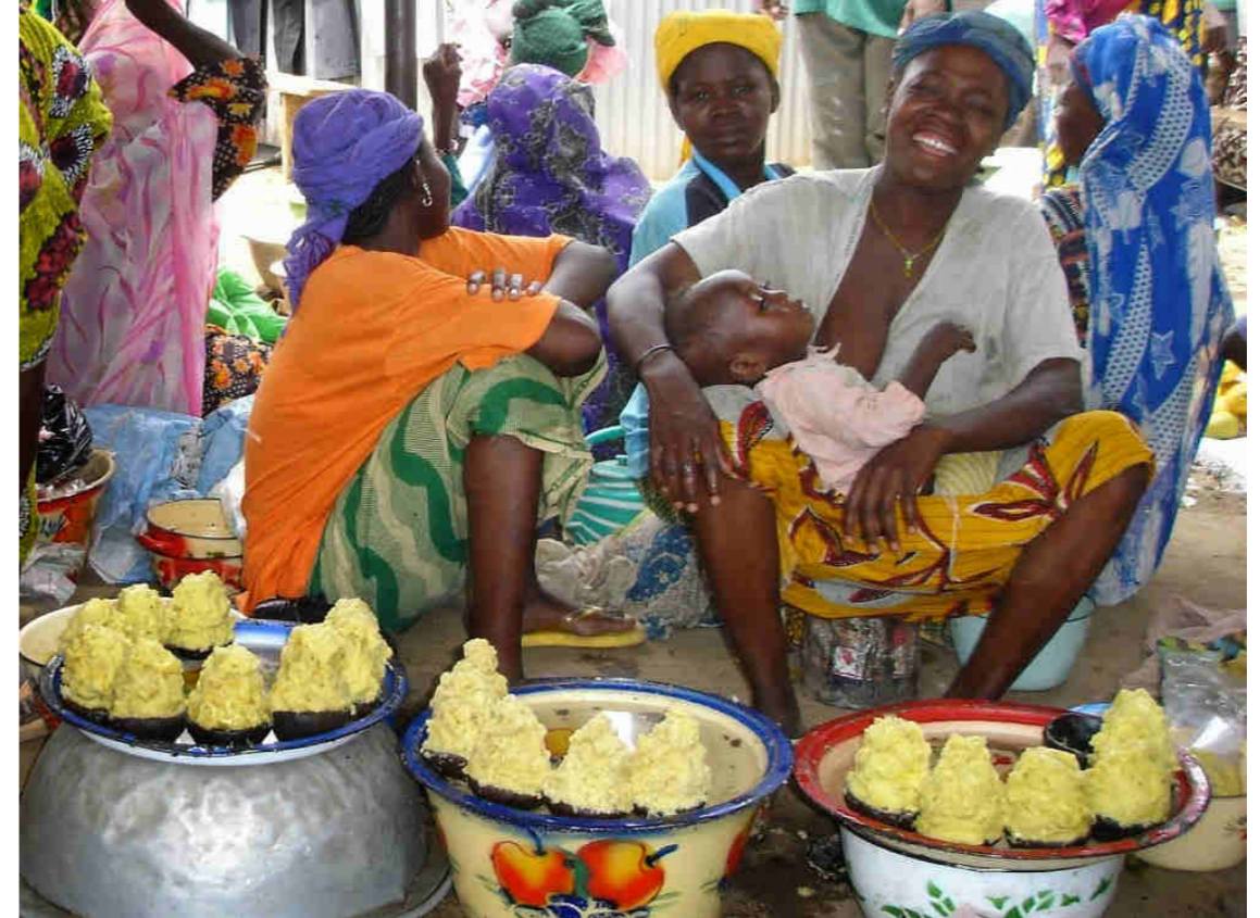
Mujeres vendiendo la mantequilla de karité

De forma tradicional se consume el fruto del Karité. Es un producto grasiento que se produce en la estación seca y sirve como complemento para la alimentación de la población. También es un producto que se exporta porque es muy apreciado para la cosmética occidental.