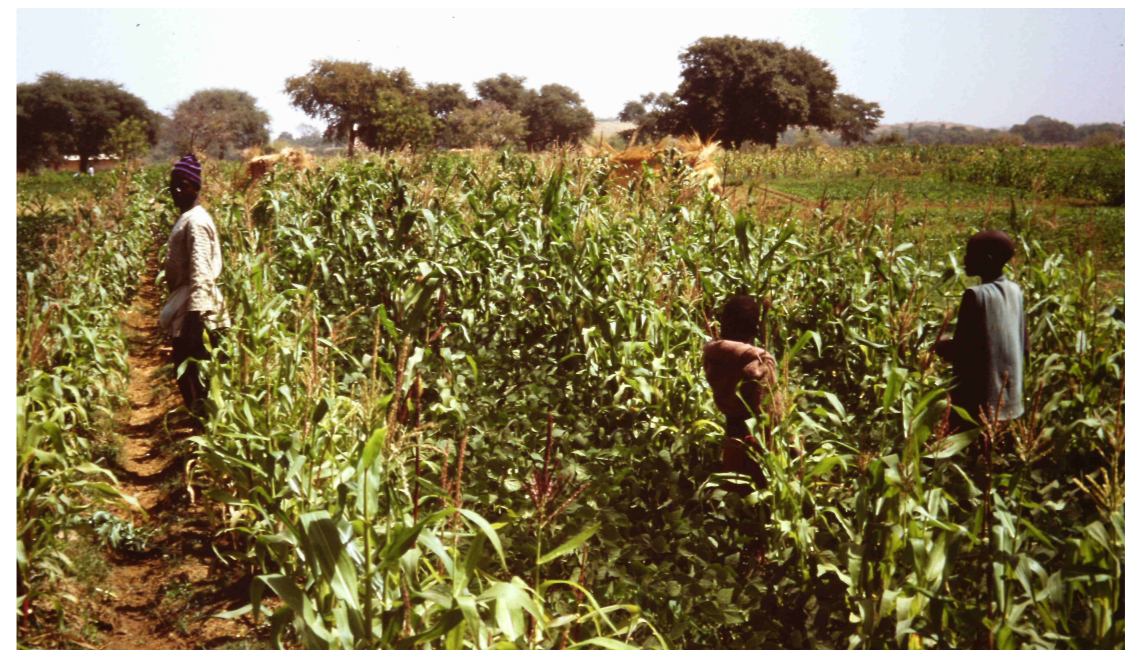
Plantas de sorgo