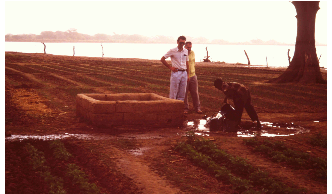
Pozo para regar los huertos al lado del lago