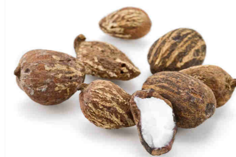
El fruto del karité

De forma tradicional se consume el fruto del Karité. Es un producto grasiento que se produce en la estación seca y sirve como complemento para la alimentación de la población. También es un producto que se exporta porque es muy apreciado para la cosmética occidental.