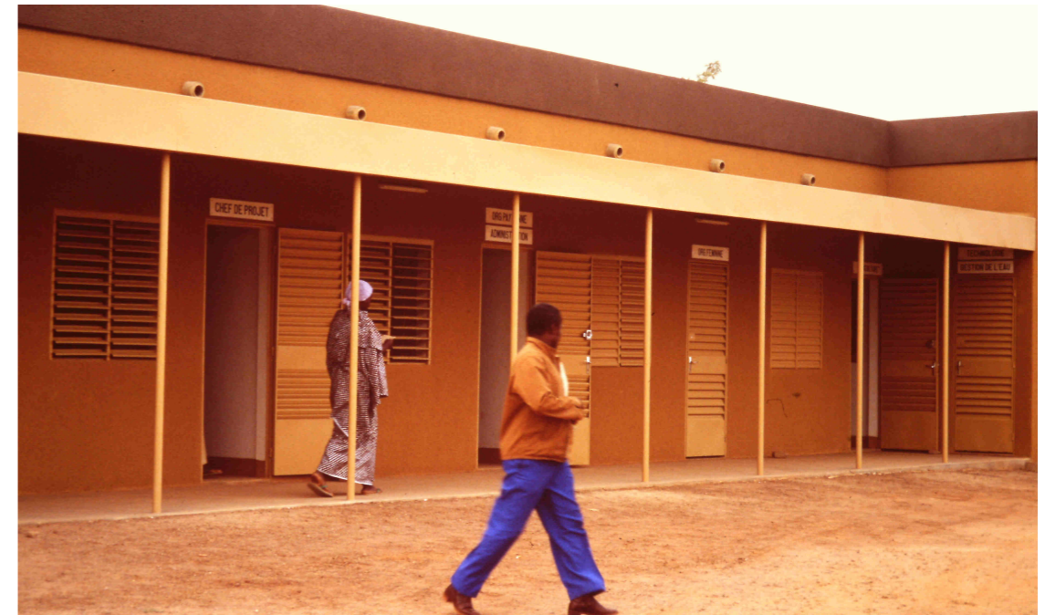
Centro de salud y atención a niños