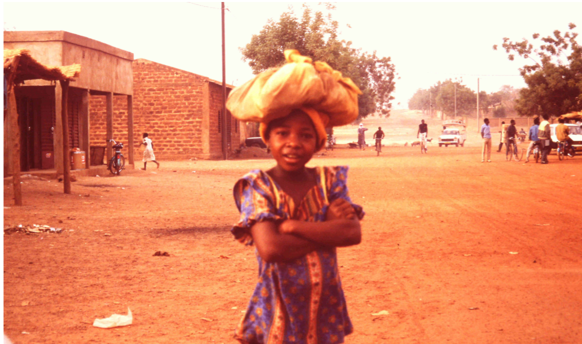
Un barrio en la periferia de Ouagadougou