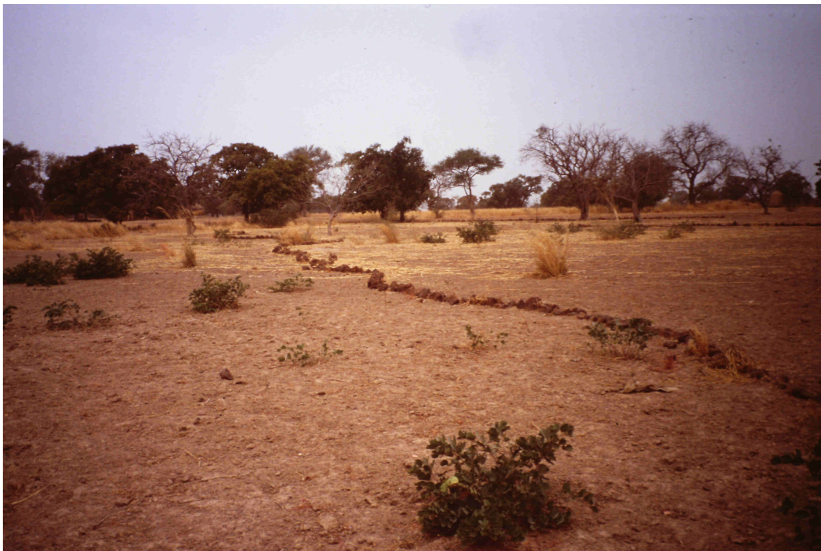
Piedras de laterita colocadas en el campo, para frenar la corriente de agua en la estación de lluvias