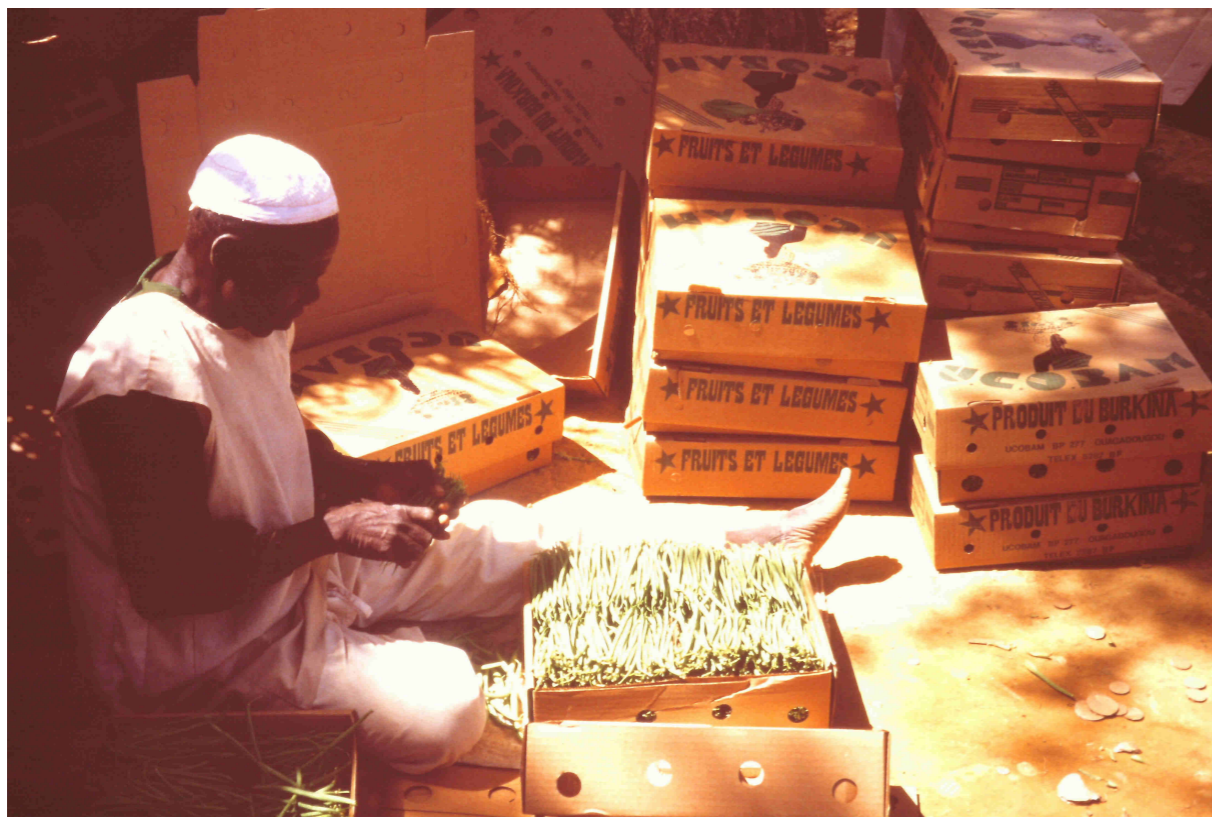
Campesino llenando pequeñas cajas con judías

Debido a la buena producción de alubias se creó el proyecto de comercialización en forma de cajas de empaquetado para mejorar su distribución a nivel local y también en otros países.