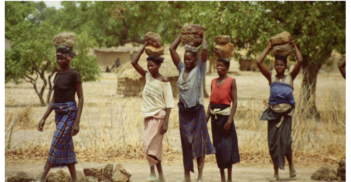
Mujeres llevando las piedras de laterita

Intermón financia proyectos a través de organizaciones locales de desarrollo. En este caso se colaboró con la organización Ville Verte. El proyecto consistía en delimitar los campos de cultivo familiares con piedras volcánicas (laterite). Así se evitaba la erosión de la tierra por las lluvias y se incrementaba la filtración de agua en el terreno de cultivo.