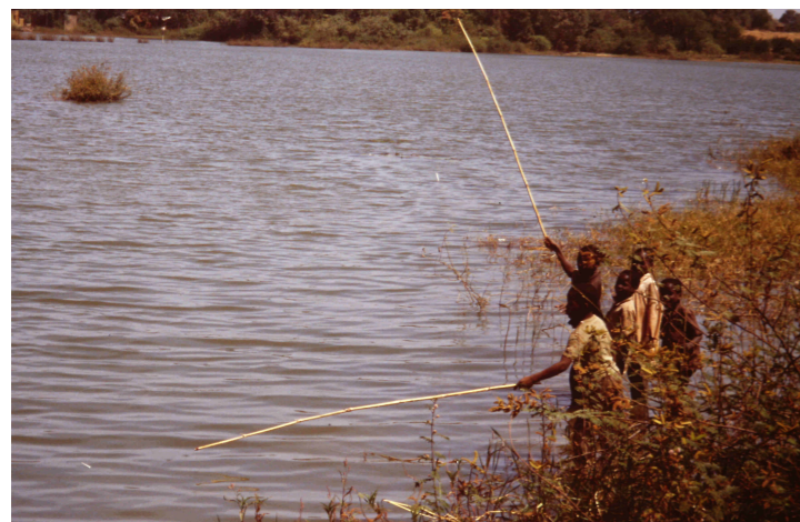
Pescadores en el lago