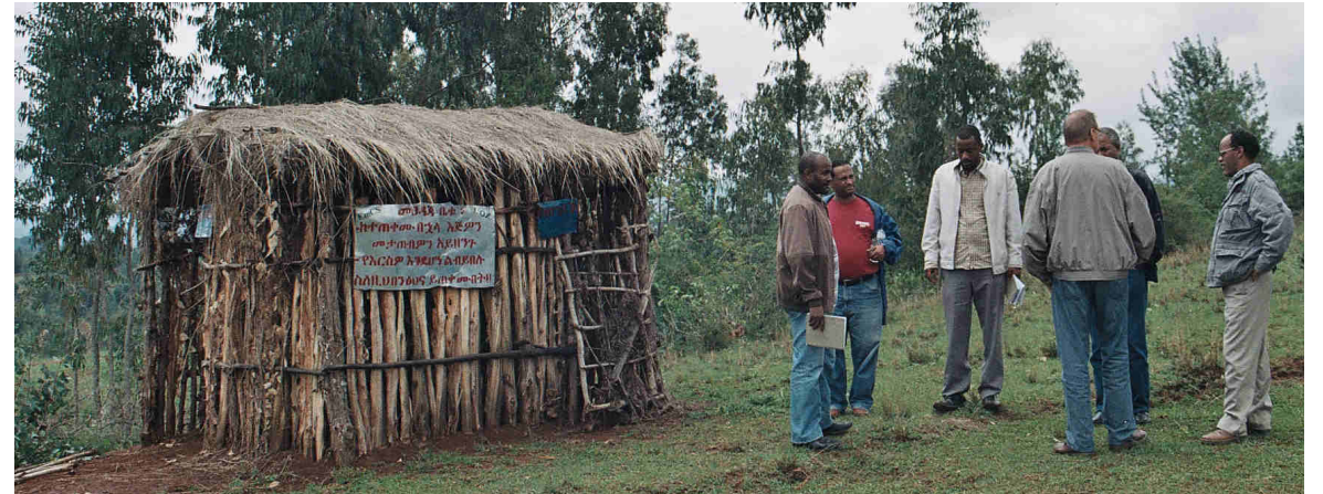
Letrinas tradicionales; un lado es para los hombre y el otro lado para las mujeres