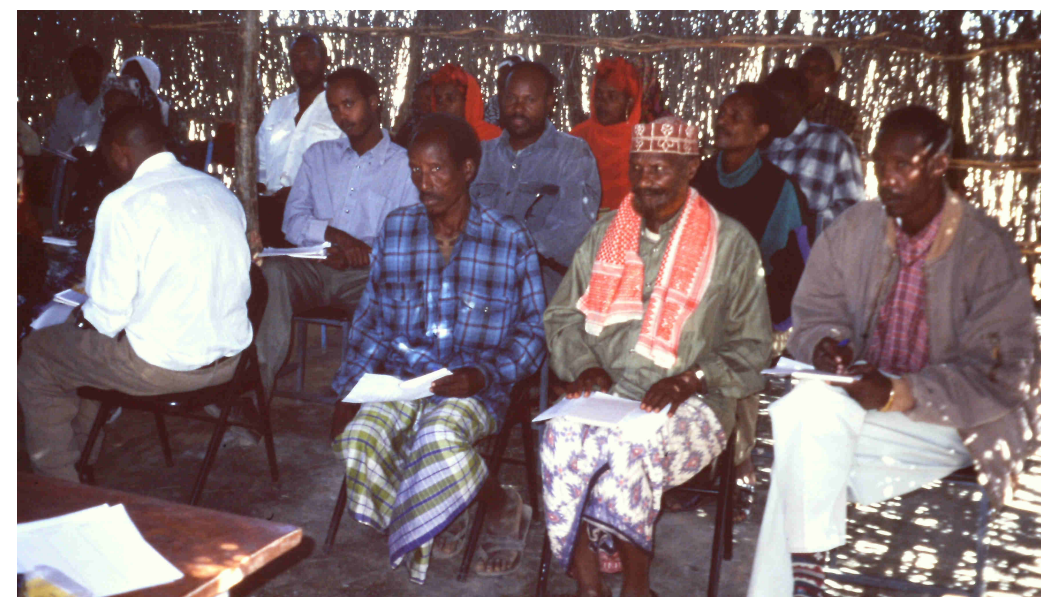
Reunión para decidir y concretar el proyecto