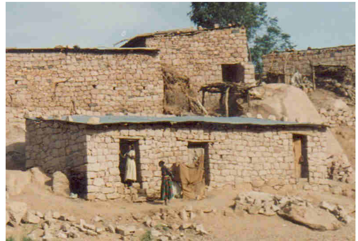
Casas donde vive la gente

El río Nilo tiene dos afluentes; el Nilo Azul que nace en Etiopía, y el Nilo Rojo que nace en las montañas de Rwanda y Burundi.