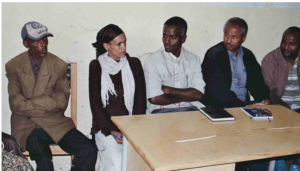
En la inauguración de los Centros Sociales las autoridades me agradecieron personalmente el proyecto.