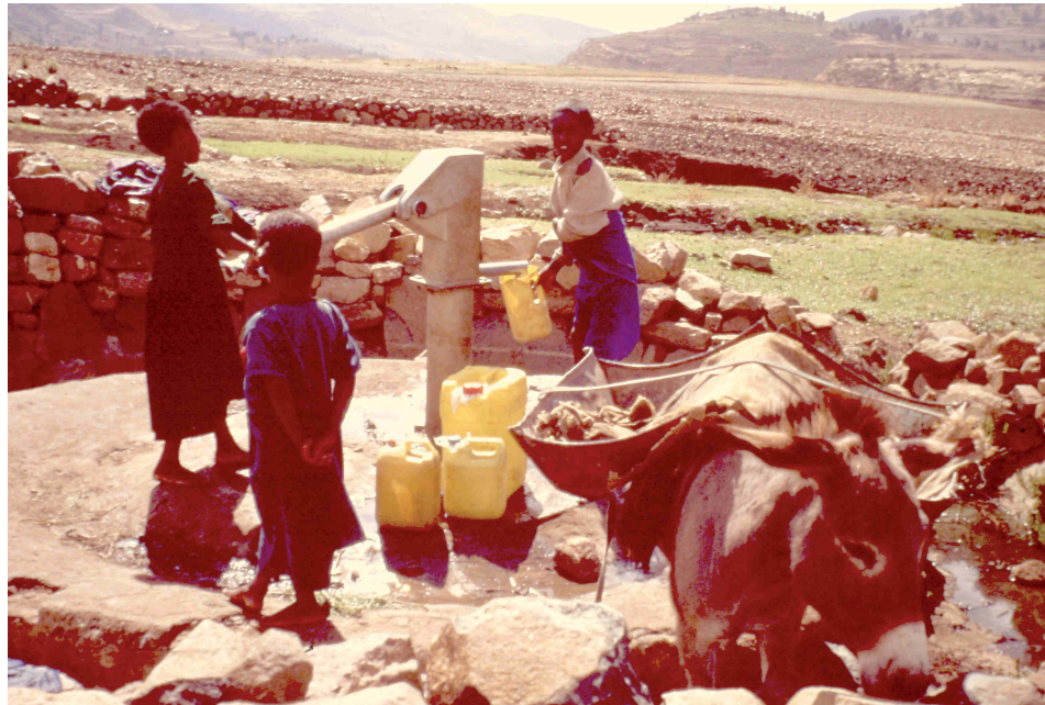
Burritos para transportar los bidones de agua

Se realizó la instalación de 4 bombas manuales en pozos tradicionales para mejorar la seguridad y eficacia en la recogida de agua.