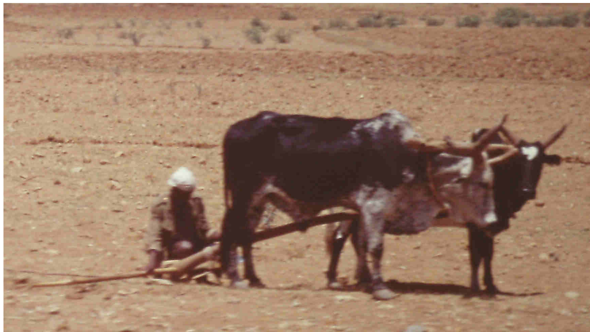
Preparando el campo para sembrar