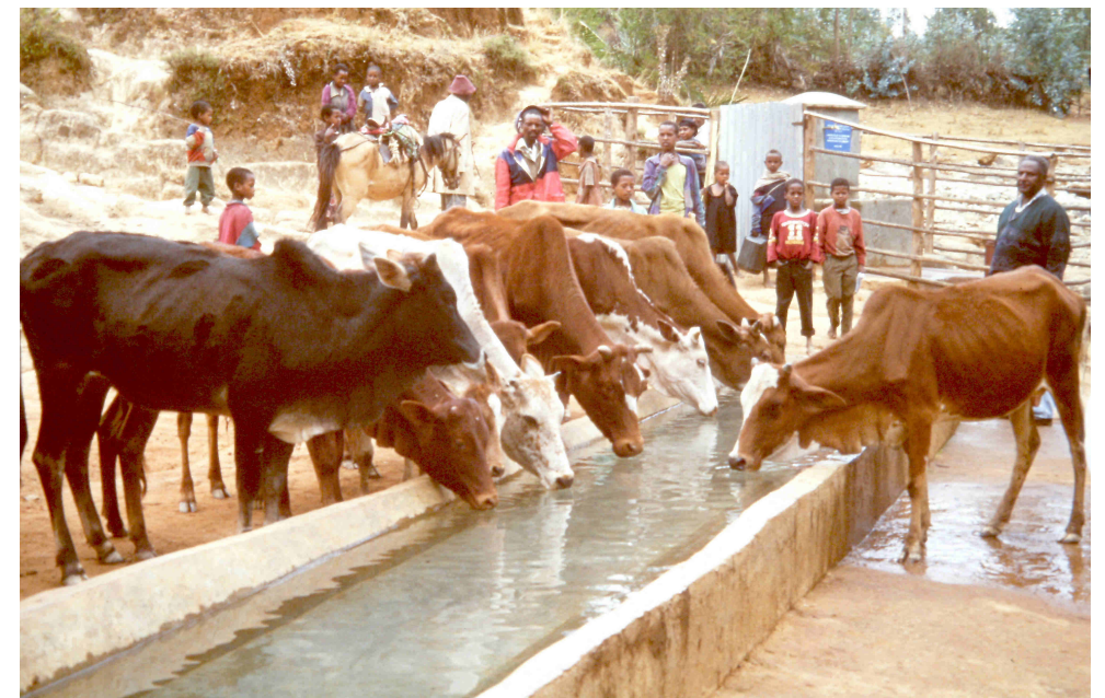
Abrevaderos para los animales con agua que proviene de los depósitos centrales