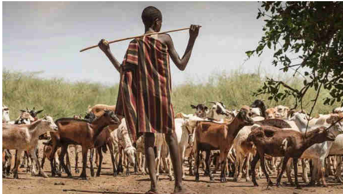
Pastor de cabras