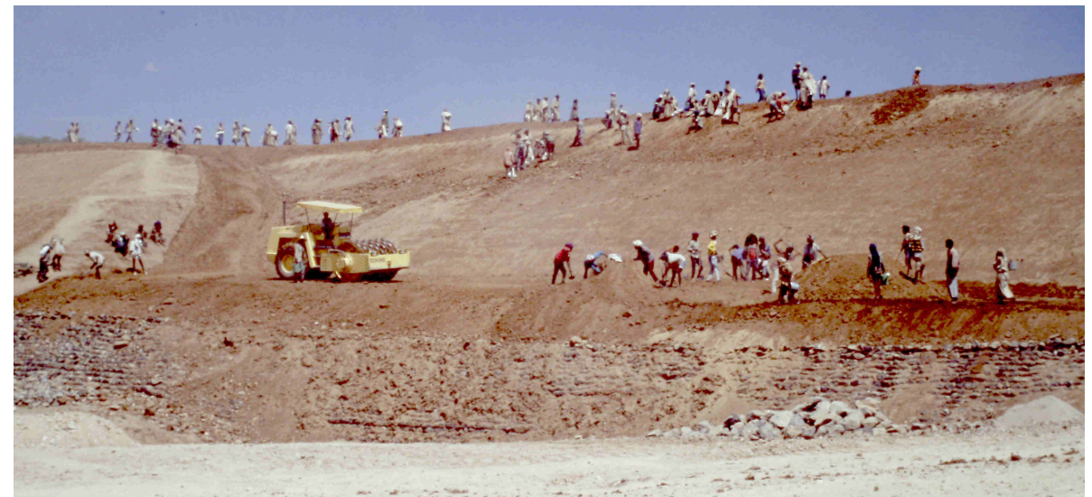
Maquinaria y personas trabajando para crear el embalse

Este embalse, ubicado en la parte alta de la montaña, proveerá de agua a los depósitos que estarán ubicados cerca de los pueblos.