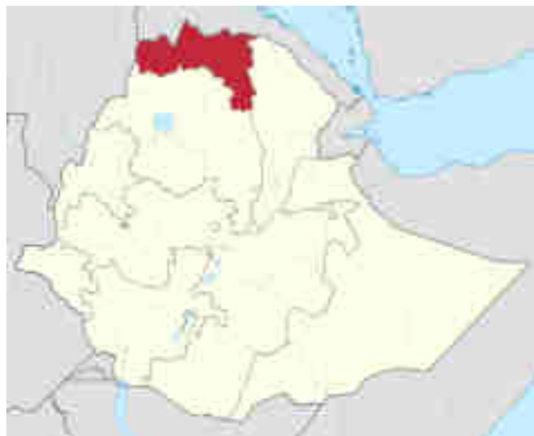
Ubicación de la Región de Tigray