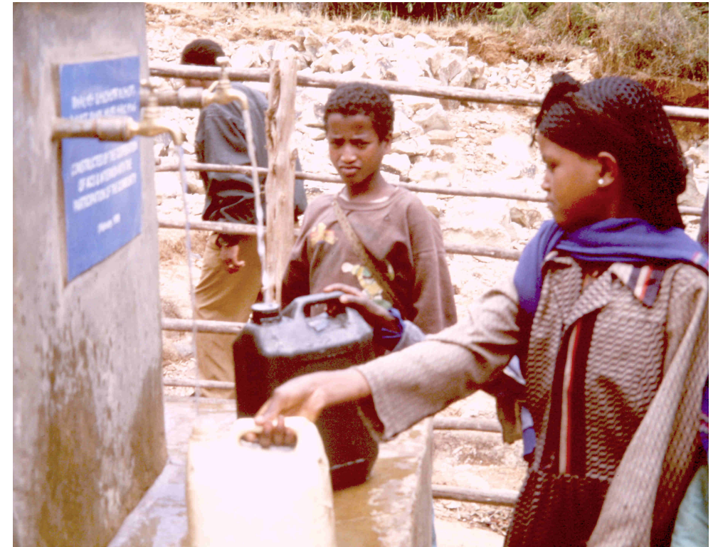
Mujeres recogiendo agua que llega del depósito central