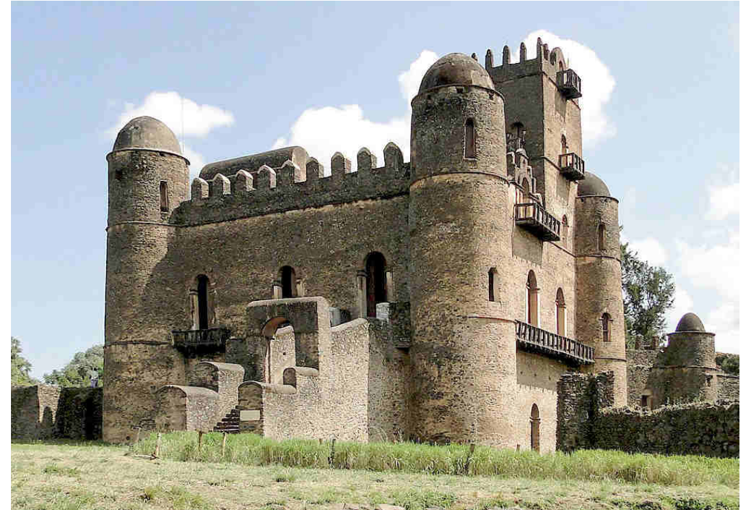
Castillo de Fasilides, Gondar

En 1952, la ONU aprobó la federación de los Estados de Etiopía y Eritrea.