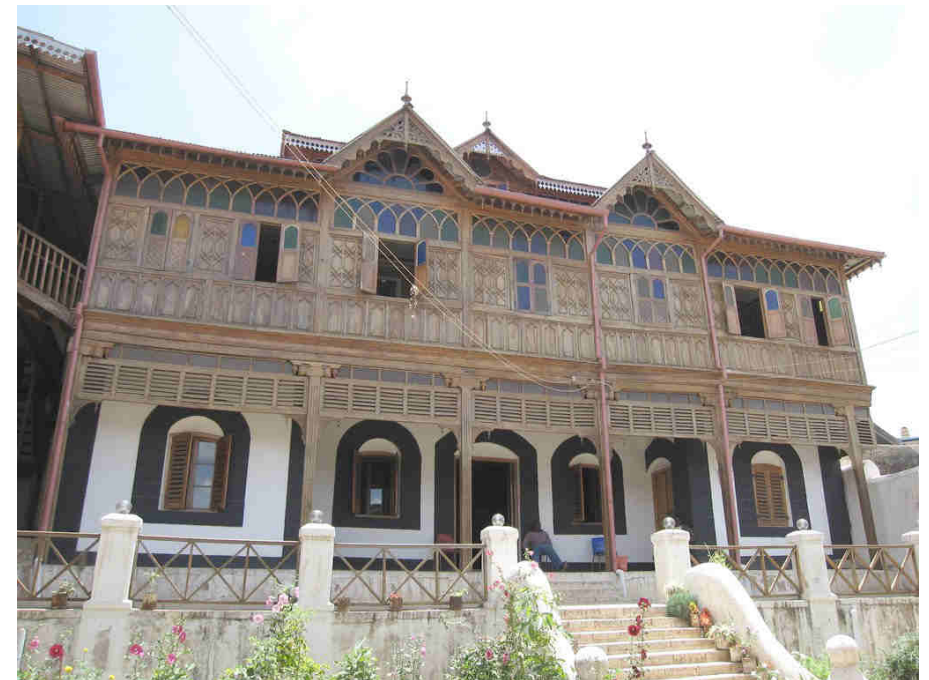
Uno de sus palacios