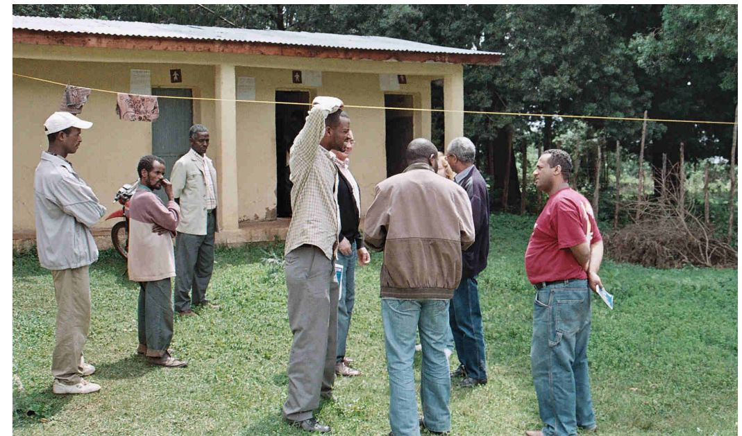
Gracias al proyecto se construyeron 15 letrinas públicas, que disponían de un grifo con agua proveniente de los depósitos.