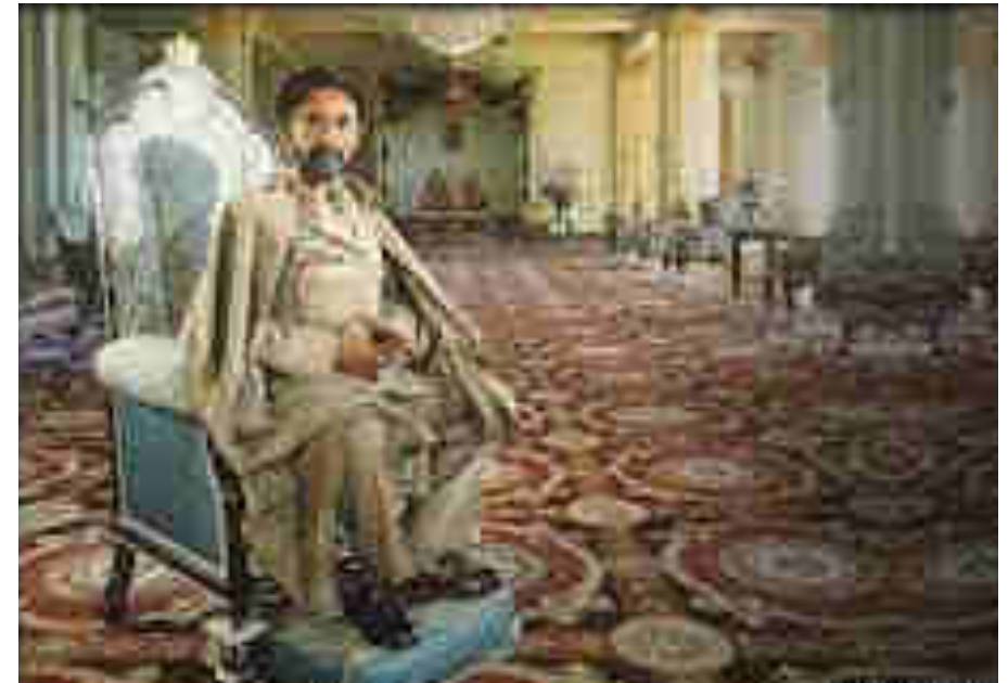
Haile Selassie I

Después del dictador Haile Selassie I, se estableció la República Democrática de Etiopía. Su actual presidenta es Sahle-Work Zewde.