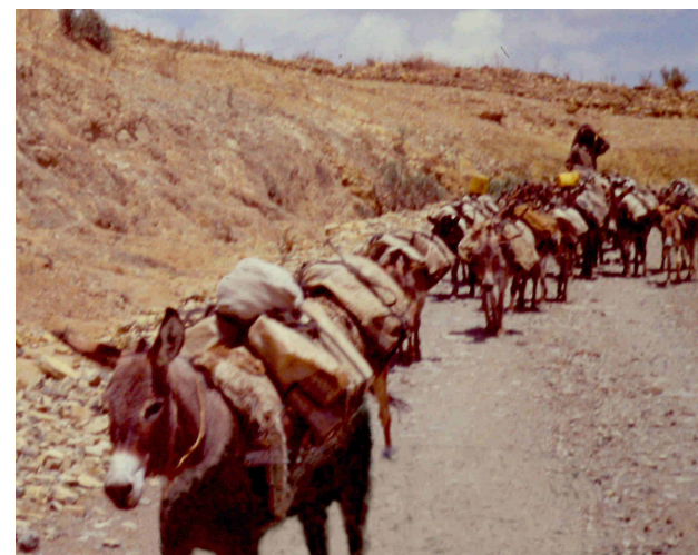
Transporte de piedras y arcilla para colocar en el fondo del embalse