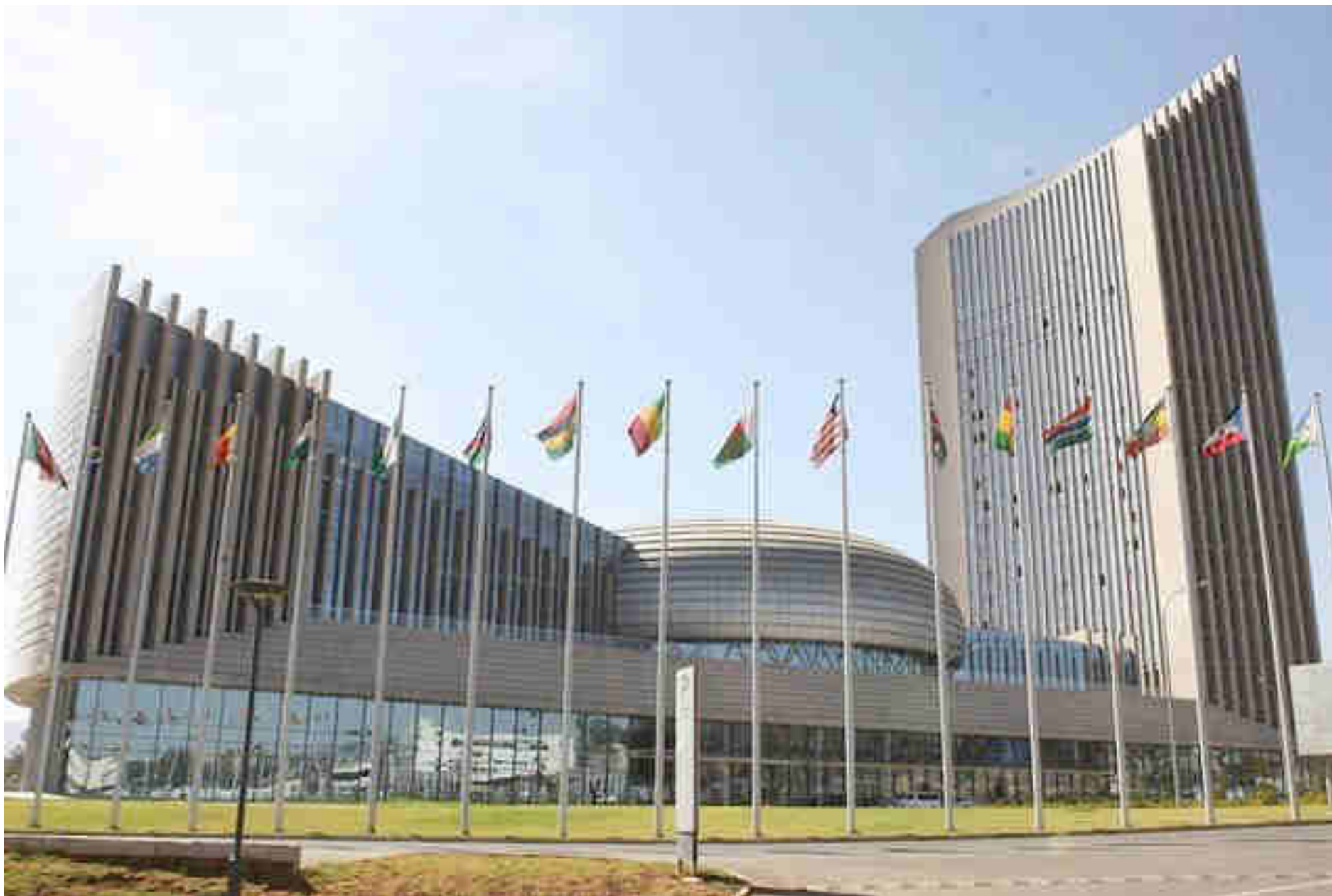
La sede de las Naciones Unidad de África, en Addis Abeba